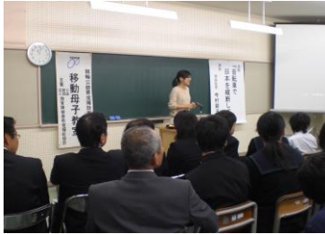
<金沢市における移動母子教室>

( http://www13.plala.or.jp/wasedanomori/page05.html )